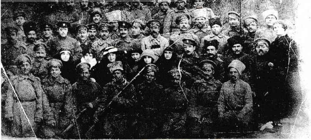
Regiment moldovenesc, 1917