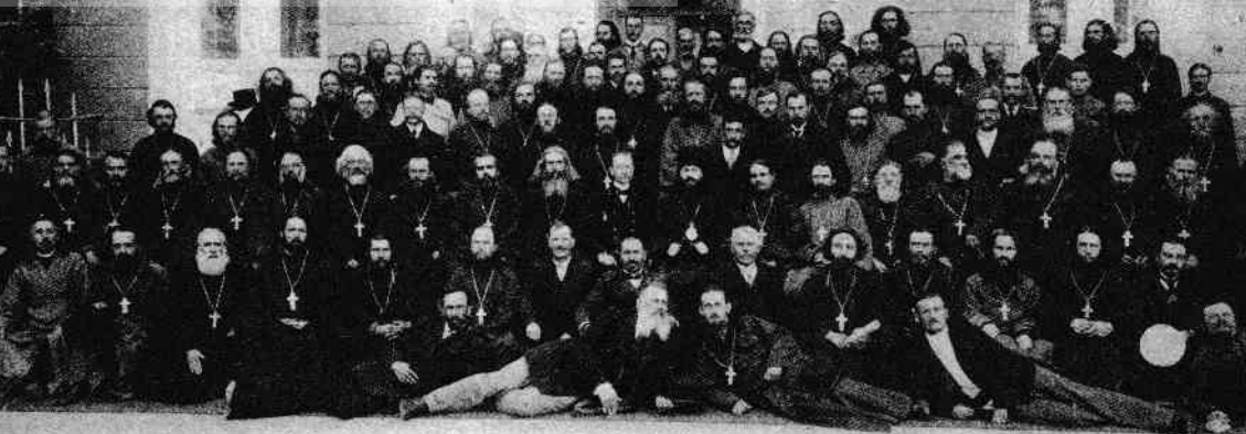
Participanți la Congresul Eparhial din 19 aprilie 1917.

sului figurau următoarele chestiuni: raportul de activitate al Sovietului din Chișinău al deputaților muncitorilor și soldaților; raportul cu privire la activitățile sovietelor locale; raportul privind momentul politic actual și sarcinile ce rezultă din chestiunea națională în Rusia, raportată la situația locală.