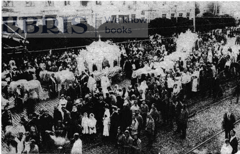
Funeraliile martirilor Simeon Murafa și Andrei Hodorocea, august 1917